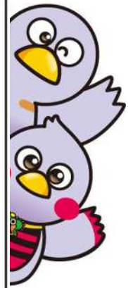
埼玉県のマスコット コバトン&さいたまっち