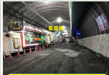
集塵機 トンネル内の粉じんをきれいにする装置です