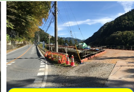
付替え道路 栈橋工事が完了し道路取合い箇所を施工しています