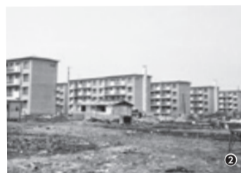
①-④: 埼玉県立文書館収蔵 埼玉新聞社撮影戦後報道写真

人口増加に対応するため、昭和30年代から大規模な団地が各地に作られました。当時、国内最大の約5,900戸入居可能な「草加松原団地」をはじめ、「武里団地」(春日部市)や「みさと団地」(三郷市)などが代表的です。これらの団地に合わせて鉄道の駅も開設され、東京へ通勤する人々が暮らし始めました。