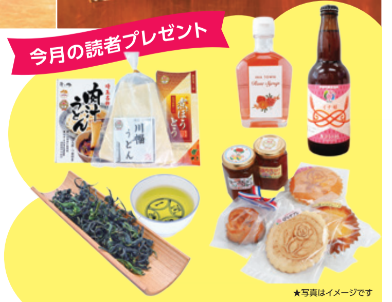
★写真はイメージです