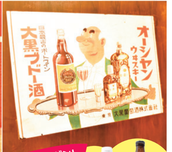
▲昭和の横丁や商店街を再現した「全国ご当地グルメコート「大宮横丁」」(JR大宮駅構内)