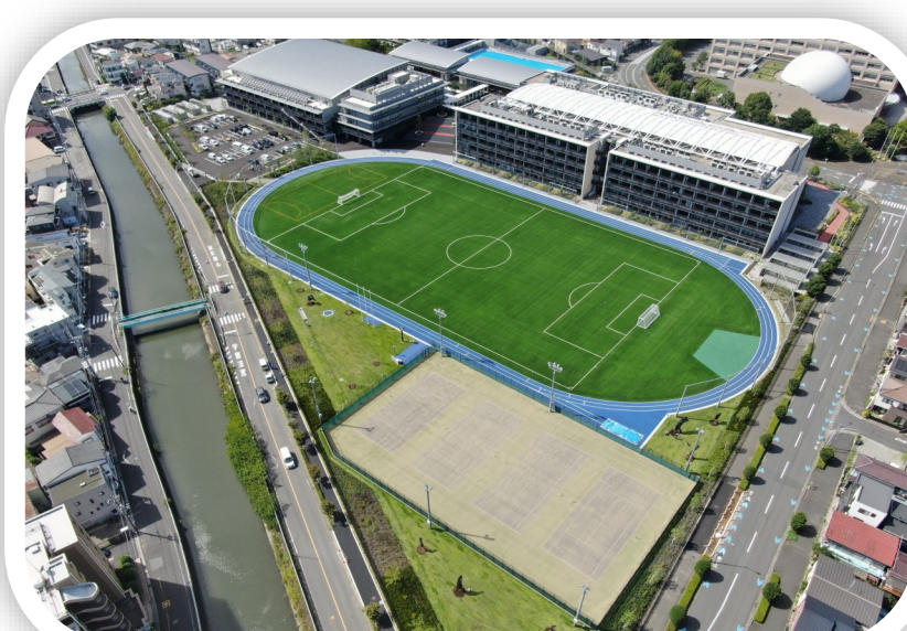
川口市立高等学校グラウンド

教育関連施設を教育行政の資源と捉え、安全かつ適正に整備することにより、教育行政経営の基盤強化を図るとともに、効率的な管理・運営を行うことにより、良好な教育環境のもとで市民の、自己教育、相互教育の発展をめざします。