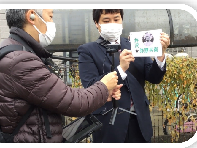
郷土資料館 オンライン社会科見学