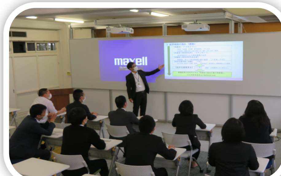
教育研究所 Future classroom