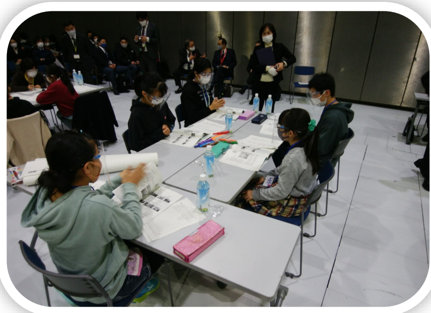
いじめゼロサミット

学校・家庭・地域と行政が相互に補完・連携しながら、さまざまな社会経験の場や見守りの機会を増やし、子どもの成長をサポートする基盤をより強固なものにしていきます。