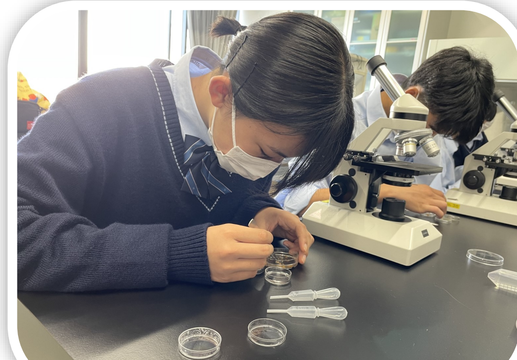
川口市立高等学校 スーパーサイエンスハイスクール