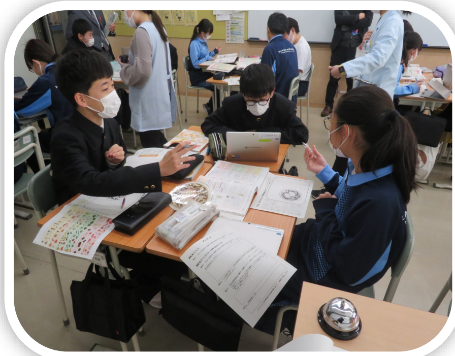
川口市立高等学校附属中学校