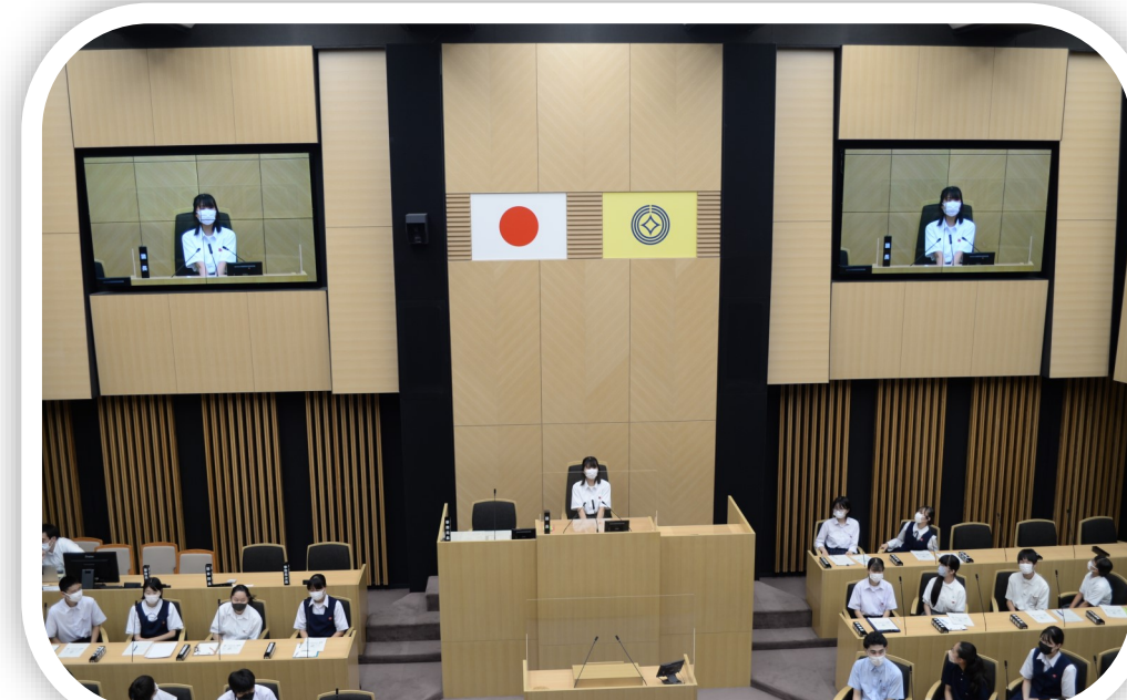
市長とのふれあいトーク