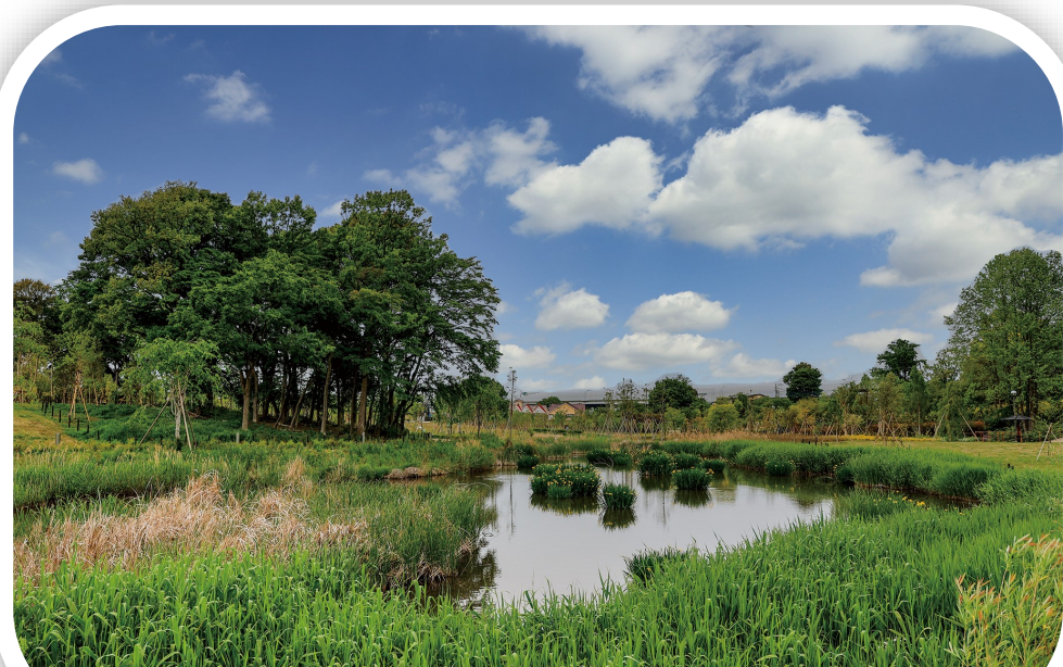
イイナパーク川口 トンボ池