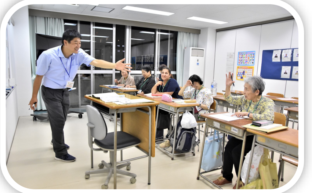
夜間中学(芝西中学校陽春分校)