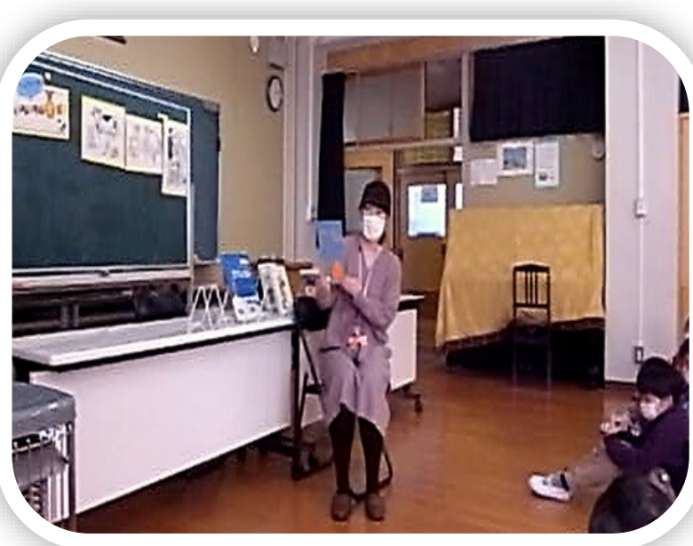
中央図書館 ブックトーク

自己実現をめざす市民の多様な学習・活動意欲の高まりに対応するため、さまざまな支援を行い、一人ひとりの個性や魅力を伸ばす環境をつくります。